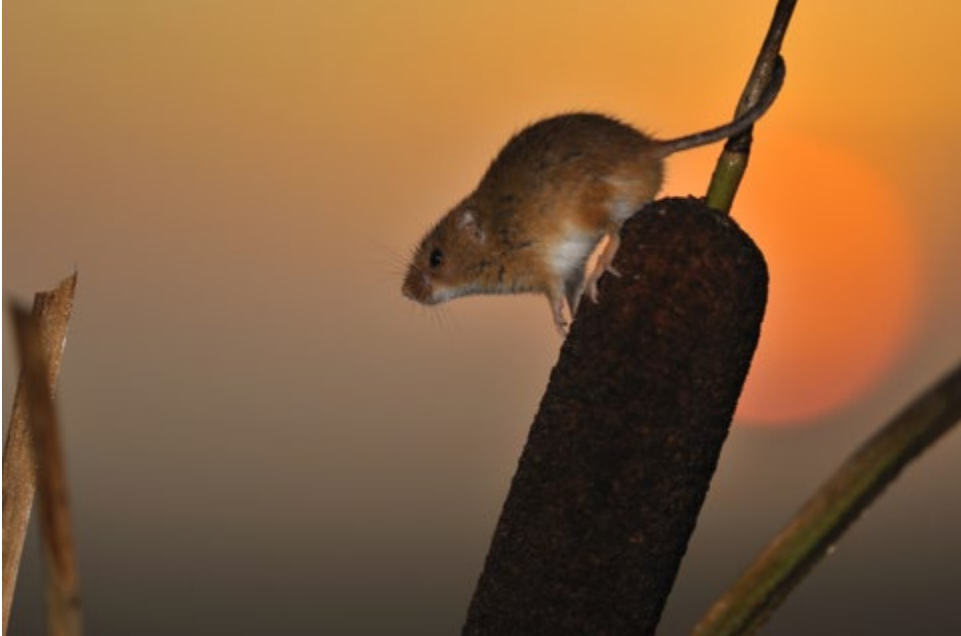
▲ Rat des moissons au soleil couchant en Vendée (85), 2009